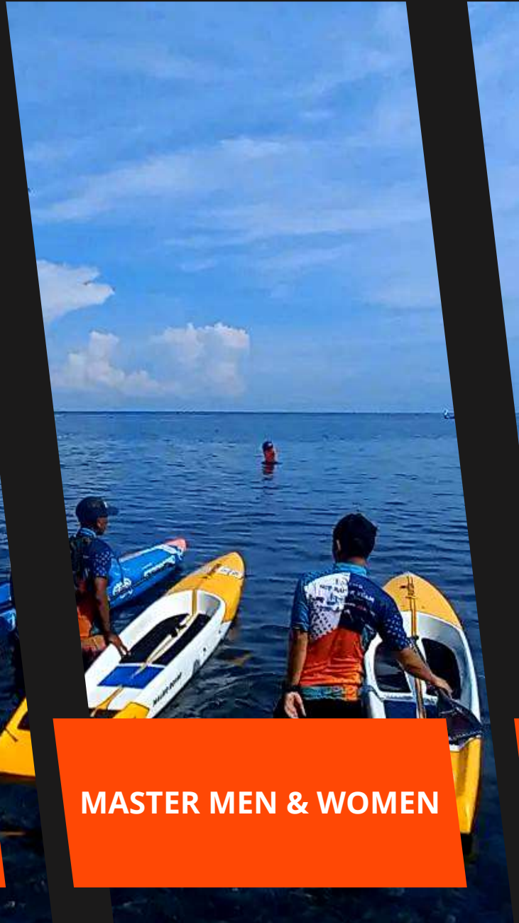
MASTER MEN & WOMEN