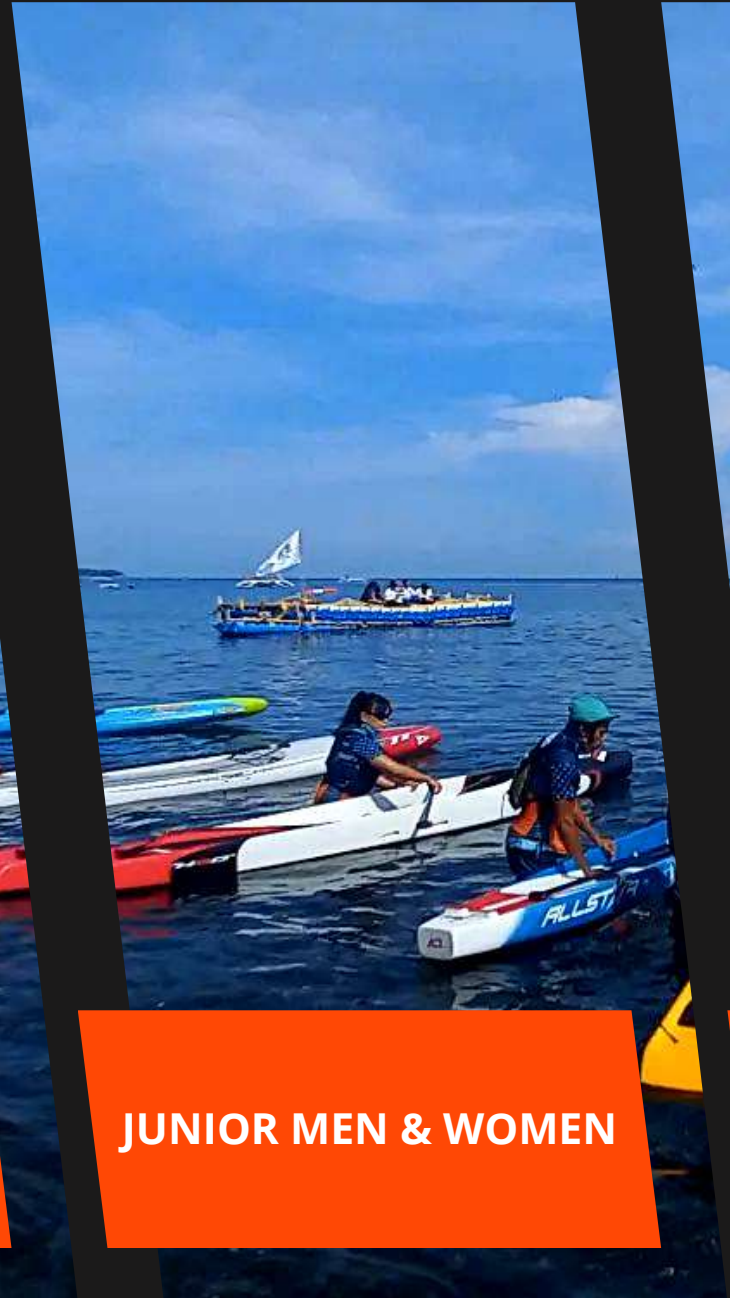
JUNIOR MEN & WOMEN