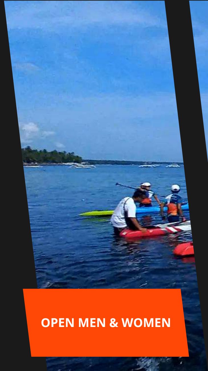
OPEN MEN & WOMEN